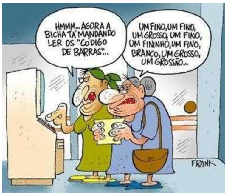
Figura 1 – Charge sobre o analfabetismo digital

foi criado em 1997 por Gilberto Dimenstein, o auto do livro "cidadão de papel" publicado em 1993. O analfabetismo digital causa diversas consequências no dia a dia das pessoas que acabam não tendo acesso a essa informação, por exemplo: as dificuldades encontradas por pessoas de idade mais avançada ao precisarem usar um serviço específico no caixa eletrônico de um banco ou a necessidade de algumas empresas de contratarem funcionários com o básico de informática, acaba prejudicando as pessoas que não tem tal capacidade. E a economia certamente olha para isso como algo que deve ser tratado com certa urgência já que a falta de acesso deixa inúmeras pessoas desempregadas, também é fato que muitas empresas do Brasil e do mundo tem ampliado ou até migrado para a internet. Nos últimos anos a necessidade de capacitação digital foi inflamada graças ao isolamento social que sofremos devido a COVID 19, com isso vimos q o analfabetismo digital é um problema não só profissional como acadêmico já que os alunos brasileiros foram forçados a continuar as atividades remotamente. A facilidade do acesso à informação na internet deve ser um direito de todos e algum que deve ser buscado nos próximos anos.